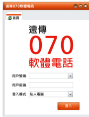
以上為示意圖，畫面以實際軟體為準